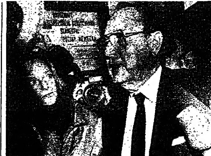
مبعوث متحدثا الى الصحفيين داخل سفارة بلاده في براغ (رويتز)

اختتمت بريطانيا والصين محادثات استمرت ثلاثة ايام بشأن هونغ كونغ. وهما لا تزالان مختلفتين بشدة فيما يتعلق بالاستعدادات لإعادة المستعمرة للسيادة الصينية في عام ١٩٩٧ والاجتماع الذي عقد في لندن. هو الاول من نوعه منذ حظرت بريطانيا اجراء اتصالات رفيعة مع الصين. بعد ان سقطت القوات الصينية تقاعدت مطالبة بالديمقراطية في ميدان تيانانمن في بكين. في حزيران الماضي، اعلنت هناك خلافات حادة مع بريطانيا، فيما يتعلق بعقوبة اعادة الثقة بين سكان هونغ كونغ. واصر الوفد على نشر قوات هناك. بعد ان تعود المستعمرة الى السيادة الصينية.